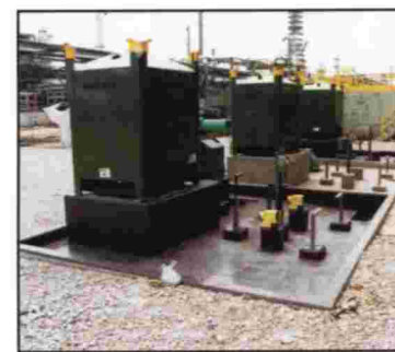
AREAS DE CONTENCIÓN DE QUÍMICOS