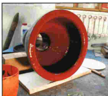
EQUIPOS DE PROCESOS