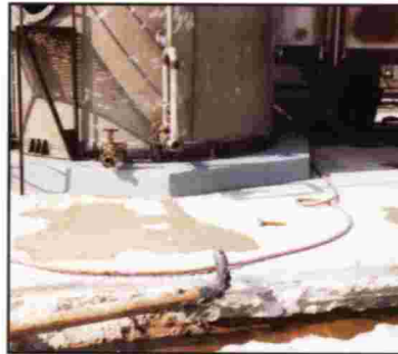
BASES DE SOPORTE

Ya sea para reparaciones de áreas sujetas a ataque por ácido inorgánico, daños mecánicos, o temperaturas elevadas, el Belzona® 4181 es el material a elegir.