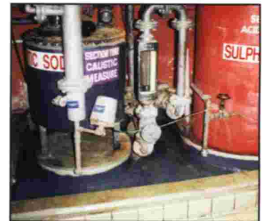
AREAS DE CONTENCIÓN DE QUÍMICOS