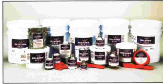
BELZONA® SERIE 4000 POLIMEROS MAGMA