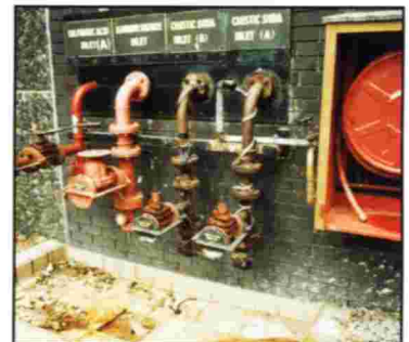
TRANSFERENCIA DE QUÍMICOS Y COMBUSTIBLES