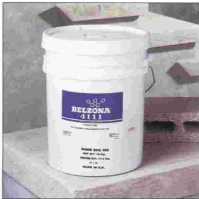
DISPONIBLE EN UNIDADES DE 15 KG. (33 LBS.)