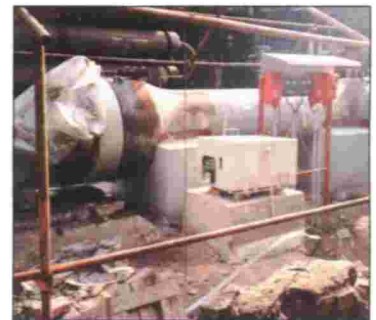
PLATAFORMAS DE SOPORTE