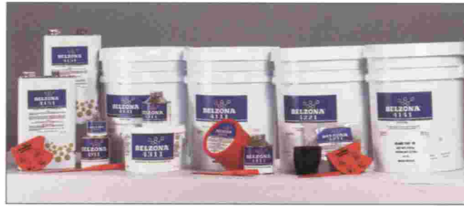
BELZONA SERIE 4000