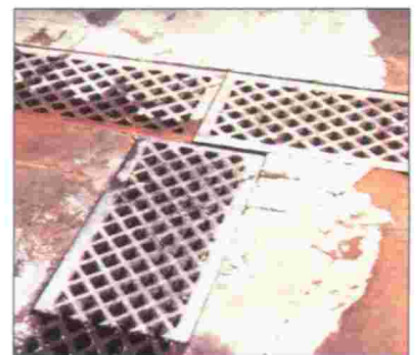
RECONSTRUCCIÓN DE CANALETAS